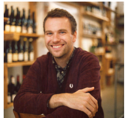
CHRISTIAN LEBHERZ / COOLCLIMATE